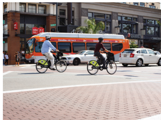
Cruces peatonales marcados mejoran la seguridad y la comodidad de los peatones.