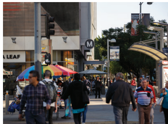
Aceras seguras son esenciales para que las personas accedan al transporte público.